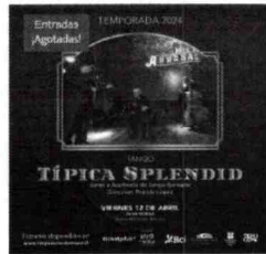
Tango Típica Splendid I Viernes 12 de abril 20:00 hrs.

El Concierto II de la Orquesta Filarmónica de Temuco 'Viva