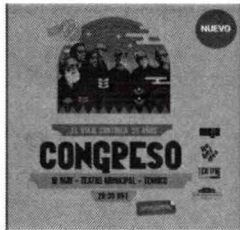
Congreso - El Viaje Continúa 55 años, Sábado 18 Mayo 20:00 hrs.

Son 55 años ininterrumpidos de trabajo, los que tiene la