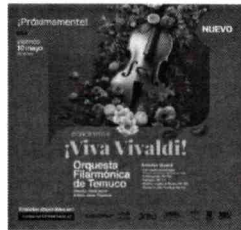
Concierto II - ¡Viva Vivaldi!, Viernes 10 Mayo 20:00 hrs.

Son 55 años ininterrumpidos de trabajo, los que tiene la