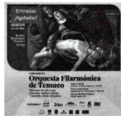
Concierto I OFT Semana Santa, 28 de marzo 20:00 hrs.