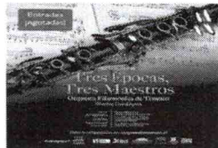
Tres Épocas, Tres Maestros - Viernes 30 de agosto 20:00 hrs. La Orquesta Filarmónica de Temuco presenta su Concierto 31 de...