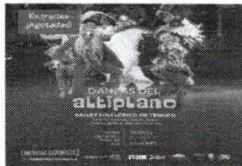
Gala Ballet Folclórico de Temuco - BAFOTE: «Danzas del Atiplano». Viernes 13 de septiembre 20:00 hrs. El Ballet Folclórico de Temuco, BAFOTE, presenta su vibrante gala...