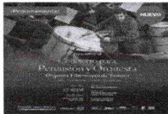
Concierto para Percusión y Orquesta - OFT Viernes 27 de Septiembre, 20:00 hrs. La Orquesta Filarmónica de Temuco, dirigida por el maestro David...