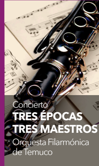
Concierto TRES ÉPOCAS TRES MAESTROS Orquesta Filarmónica de Temuco