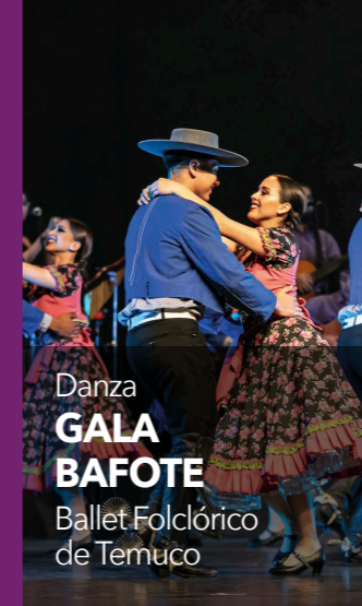
Danza GALA BAFOTE Ballet Folclórico de Temuco